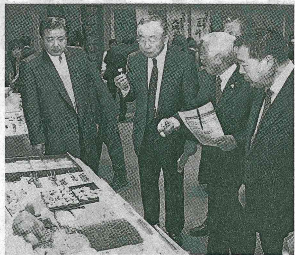
開発商品を試食する横内県知事ら(15日、山梨県昭和町)

【やまなし】山梨県は15日、昭和町のアピオ甲府で「農と食のコラボレーション講座」を開